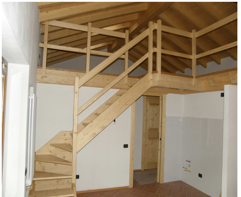
Scala e soppalco in abete

Serramenti scale arredamenti rivestimenti