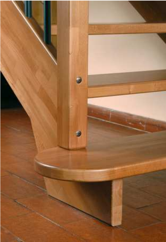
Particolare primo gradino arrotondato