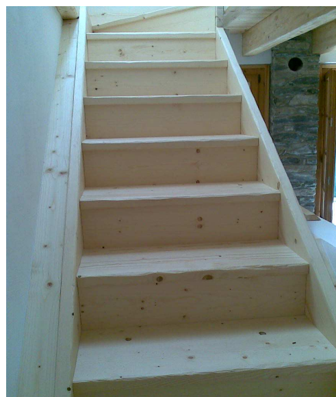
Scala in abete rustico effetto crudo