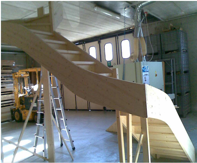
Preassemblaggio in laboratorio