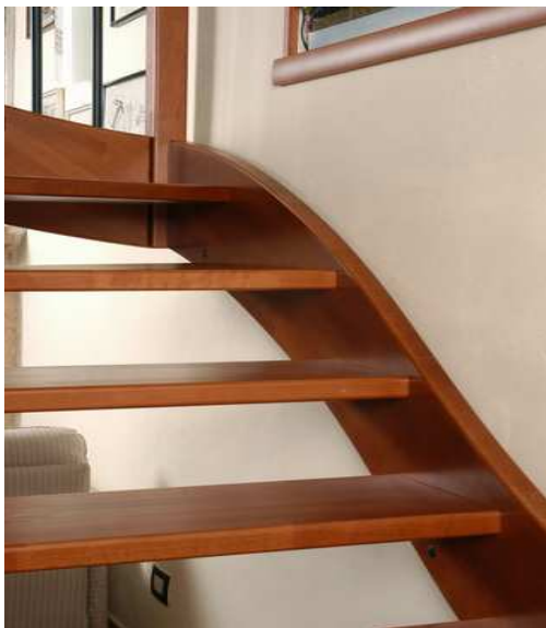
Particolare scala in faggio tinto senza alzate