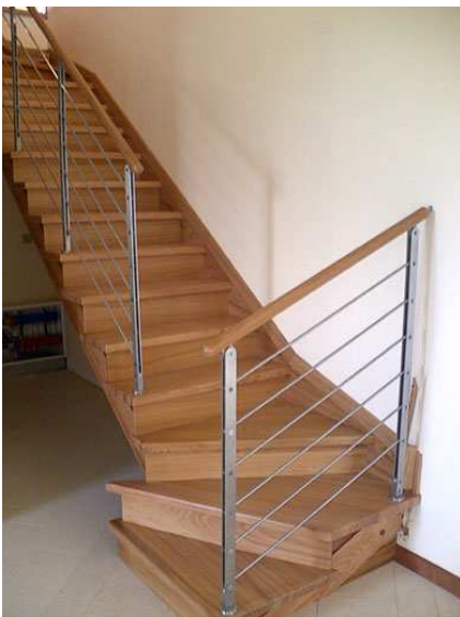
Scala in teak

Abbiamo il piacere di comunicare che nell'ambito della nostra continua evoluzione abbiamo inserito nella nostra attività un software cad/cam di ultima generazione per la progettazione di scale in legno .