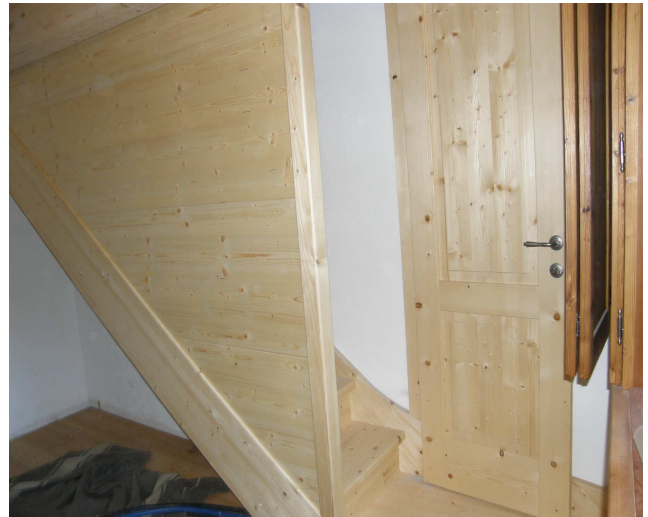
Scala chiusa in abete spazzolato